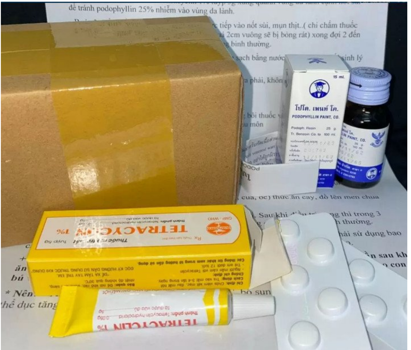
23 Thuốc trị sùi mào gà Tại Nhà ở Nữ giới, Nam giới - Thuốc điều trị Sùi Mào Gà Podophyllin 25 tại nhà