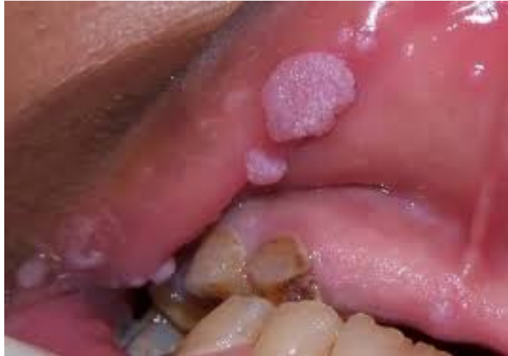
Hình ảnh sùi mào gà ở chân

Trên thực tế, sùi mào gà là loại bệnh chỉ tạo thành ở vùng niêm mạc, bán niêm mạc. rất nhiều người cảm thấy sùi mào gà mọc tại chân tay. song, một số mụn dạng tương tự như sùi mào gà ở chân tay đây không có là bệnh mà đây là một dạng khác. Nó là mụn cộc, cũng chung dòng virus HPV, tuy vậy lại không giống nhau