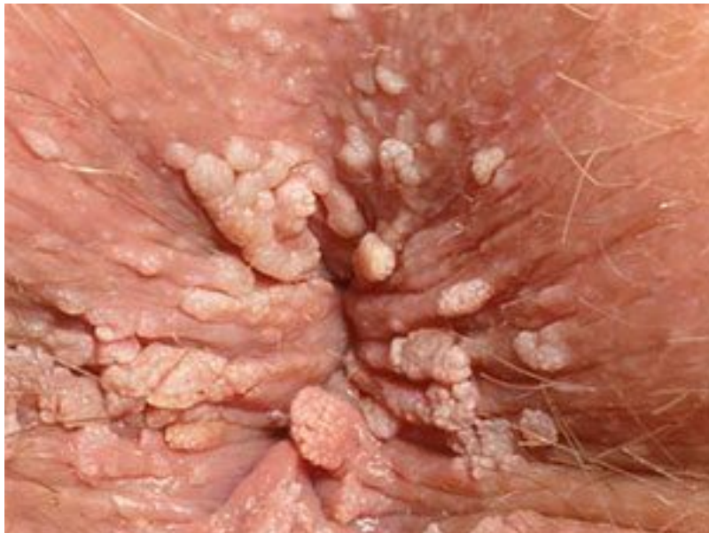
23 Thuốc trị sùi mào gà Tại Nhà ở Nữ giới, Nam giới

Bên cạnh sùi mào gà tại sinh dục. Chúng ta còn thấy sùi mào gà ở vùng hậu môn. vì thế, hình ảnh sùi mào gà vùng hậu môn cũng toàn bộ có khả năng tìm ra được. đó là tình trạng mọc mụn vùng hậu môn. tuy vậy mụn này na ná những mụn mọc tại những khu vực khác. Đặc điểm là mụn thịt mọc ở các vị trí khác nhau ở hậu môn.