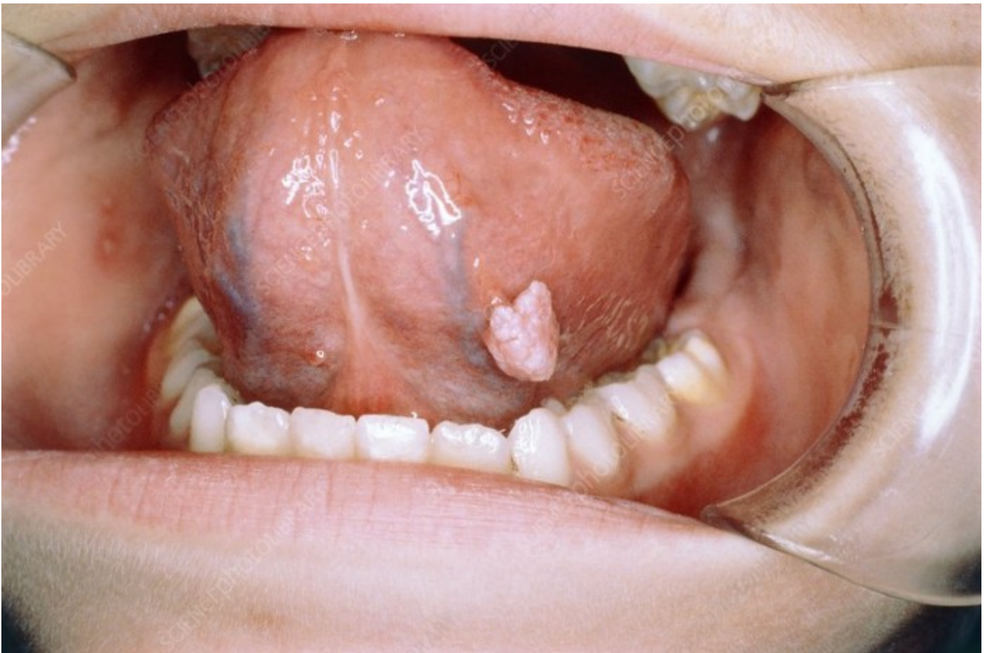
Hình ảnh nhận biết Bệnh lí sùi mào gà tại miệng lưỡi

Trong hiện trạng bạn có giao hợp bằng con đường miệng, có một số nụ hôn vào