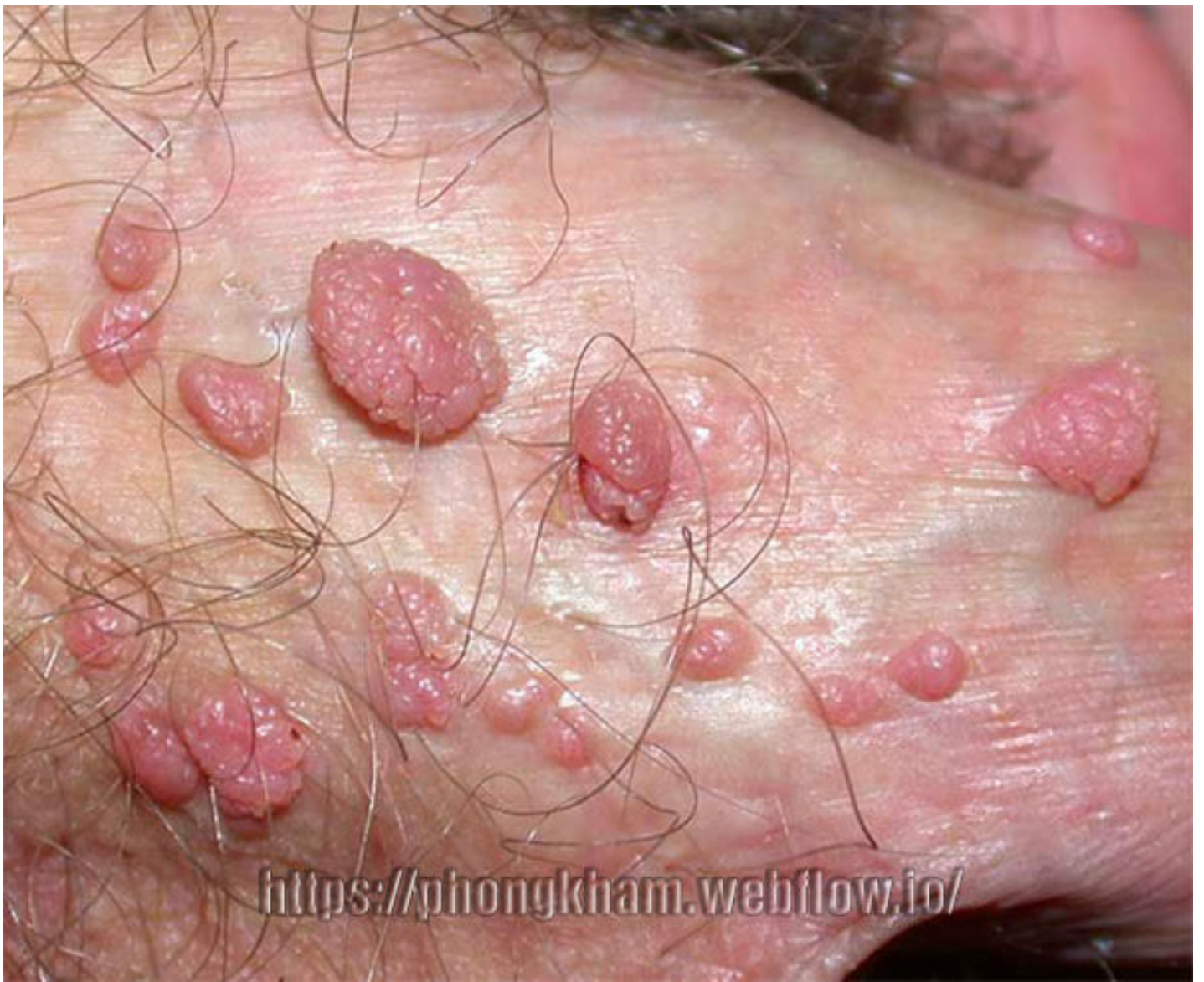
Hình ảnh bệnh sùi mào gà tại nữ giới giai đoạn đầu